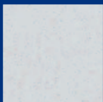
Mineralgrau Best.-Nr. 56