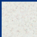
Mineralweiß Best.-Nr. 55